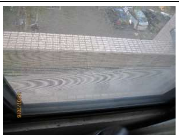
清除花盆、樹葉及垃圾。