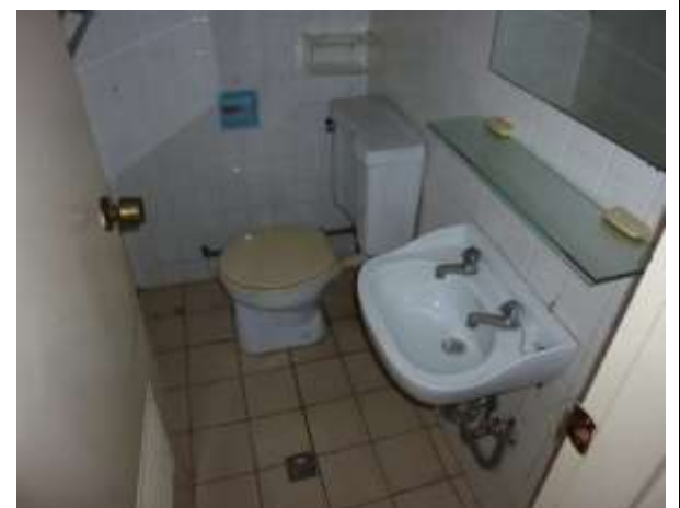
清除浴簾、衛生紙、清潔劑、肥皂、沐浴用品、馬桶刷組、刷子、通馬桶器...等私人使用物品及垃圾。